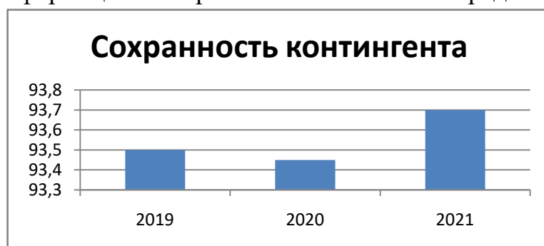
Рисунок 1. Сохранность контингента обучающихся по календарным годам

Наглядно информация о сохранности контингента представлена на рисунке